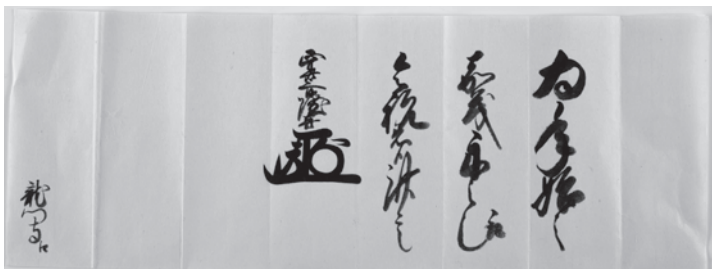
〈文書〉54 岩城隆喜書状（右：包紙）