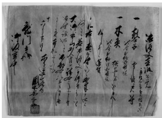
〈文書〉51 御注文直渡書覚